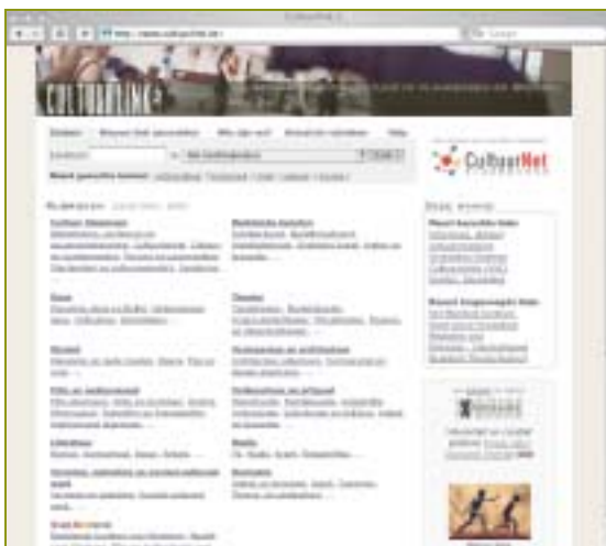
Cultuurlink.be is een site met (voorlopig) 1.600 links over cultuur in Vlaanderen en Brussel.

De lay-out van www.cultuurlink.be is sober, de navigatie heel gebruiksvriendelijk: dat alles maakt van deze overzichtssite een erg handige wegwijzer.