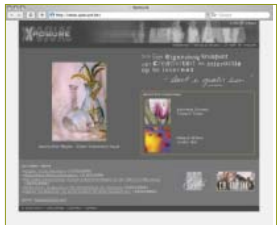
"Xposure" is een creatief en interactief platform, waar kunstenaars hun kunstwerken kunnen voorstellen.