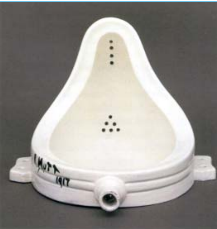
Marcel Duchamp "Fontein" (1917)

derkunst literair of religieus: ze stond volledig ten dienste van de geest. Dit kenmerk ging beetje bij beetje verloren." Kunst moet, volgens Duchamp, terug een "intellectuele expressie" worden, eerder dan een "dierlijke". Het progressieve van het standpunt van Duchamp ligt in de terugkeer naar de oude kunst. Wat Duchamp aan de schilderkunst verwijt is dat het esthetische genoeg doorgaans uitsluitend afhangt van het netvlies, zonder bijkomende interpretatie. Zijn kritiek was in de eerste plaats gericht op de impressionisten, die "in plaats van doorheen het pigment te interpreteren geleidelijk verliefd werden op het pigment, op de verf zelf." Daardoor wordt, volgens Duchamp, uit het oog verloren dat verf een middel is voor een doel. Er kunnen dus twee vormen van schilderkunst naast elkaar bestaan, de ene gebaseerd op de zintuiglijkheid en de andere op de verstandelijkheid. Het surrealisme is een voorbeeld van deze laatste. En het is de verdienste van Duchamp om dit verstandsaspect terug in de aandacht te hebben gebracht, met de prachtige gevolgen van dien. Het is belangrijk in te zien dat ze best naast elkaar kunnen leven. Ondertussen zijn er veel voorbeelden van de versmelting van beide benaderingen.