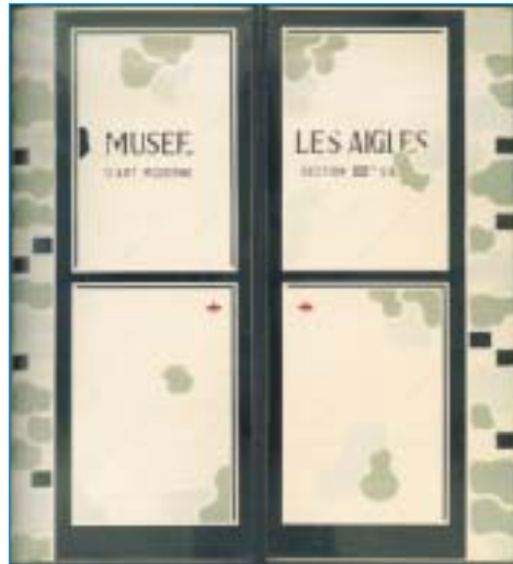
Marcel Broodthaers "Les portes du Musée d'Art Moderne, Les Aigles, Section XIX" (1969)

werk is precies de wijze waarop ze ontsnappen aan de heersende kunstvormen en niet zozeer de inhoud. Men is niet verontwaardigd wanneer men een urinoir ziet of een mosselpot, men schrikt wanneer een kunstenaar met niet-artistieke elementen een eigen artistiek systeem opbouwt. En dat heeft Broodthaers op een unieke manier gedaan.