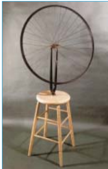
Marcel Duchamp "Roue de bicyclette" (1913)

derkunst literair of religieus: ze stond volledig ten dienste van de geest. Dit kenmerk ging beetje bij beetje verloren." Kunst moet, volgens Duchamp, terug een "intellectuele expressie" worden, eerder dan een "dierlijke". Het progressieve van het standpunt van Duchamp ligt in de terugkeer naar de oude kunst. Wat Duchamp aan de schilderkunst verwijt is dat het esthetische genoeg doorgaans uitsluitend afhangt van het netvlies, zonder bijkomende interpretatie. Zijn kritiek was in de eerste plaats gericht op de impressionisten, die "in plaats van doorheen het pigment te interpreteren geleidelijk verliefd werden op het pigment, op de verf zelf." Daardoor wordt, volgens Duchamp, uit het oog verloren dat verf een middel is voor een doel. Er kunnen dus twee vormen van schilderkunst naast elkaar bestaan, de ene gebaseerd op de zintuiglijkheid en de andere op de verstandelijkheid. Het surrealisme is een voorbeeld van deze laatste. En het is de verdienste van Duchamp om dit verstandsaspect terug in de aandacht te hebben gebracht, met de prachtige gevolgen van dien. Het is belangrijk in te zien dat ze best naast elkaar kunnen leven. Ondertussen zijn er veel voorbeelden van de versmelting van beide benaderingen.