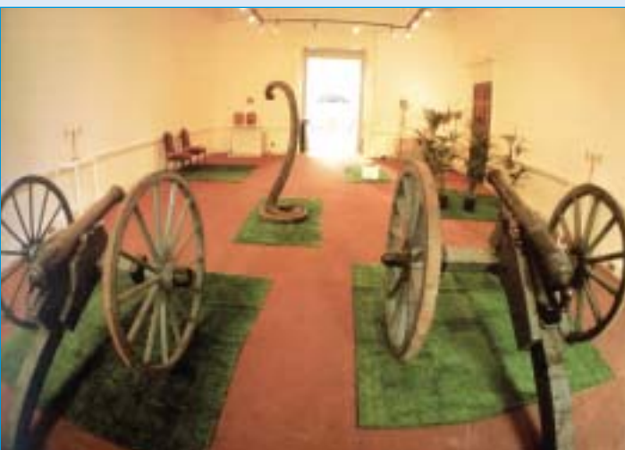
Marcel Broodthaers "Decor" (1975)

Broodthaers bekendste werken zijn de mosselpotten. Het Frans laat een woordspeling toe tussen "le moule, de moule" en "la moule, de mal". Maar er is ook een symboliek aan verbonden. De mossel maakt haar schelp zelf en kan zo als een authentiek perfecte vorm worden bekeken. Er is uiteraard ook een connotatie aan verbonden. Wie "België"