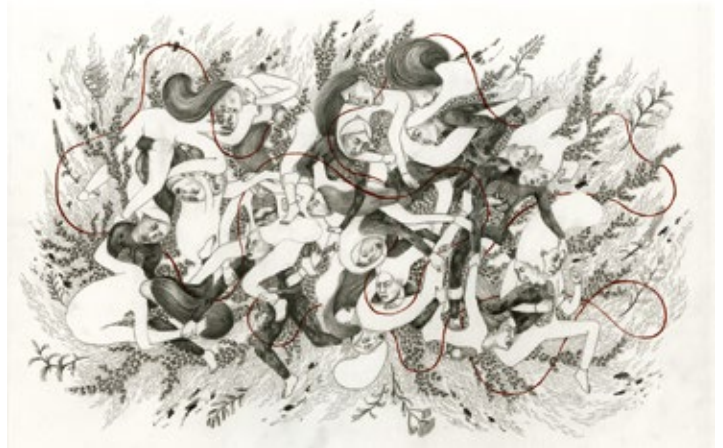
Traces of the self, 2014.

Ik vertrek vanuit een vlekkenpatroon of teken met mijn linkerhand, zodat het allemaal minder precies wordt. Dat is niet zo eenvoudig. Het onbewuste of intuïtieve, ook wel vertegenwoordigd door het archetype van de schaduw in de Jungiaanse psychologie, spreekt me erg aan. De confrontatie met de schaduwzijde gaat vaak gepaard met conflicten en verzet. Ik heb dat thema verwerkt in een beeldverhaal. Na het gevecht met de schaduwzijde volgt aanvaarding en een samensmelting.