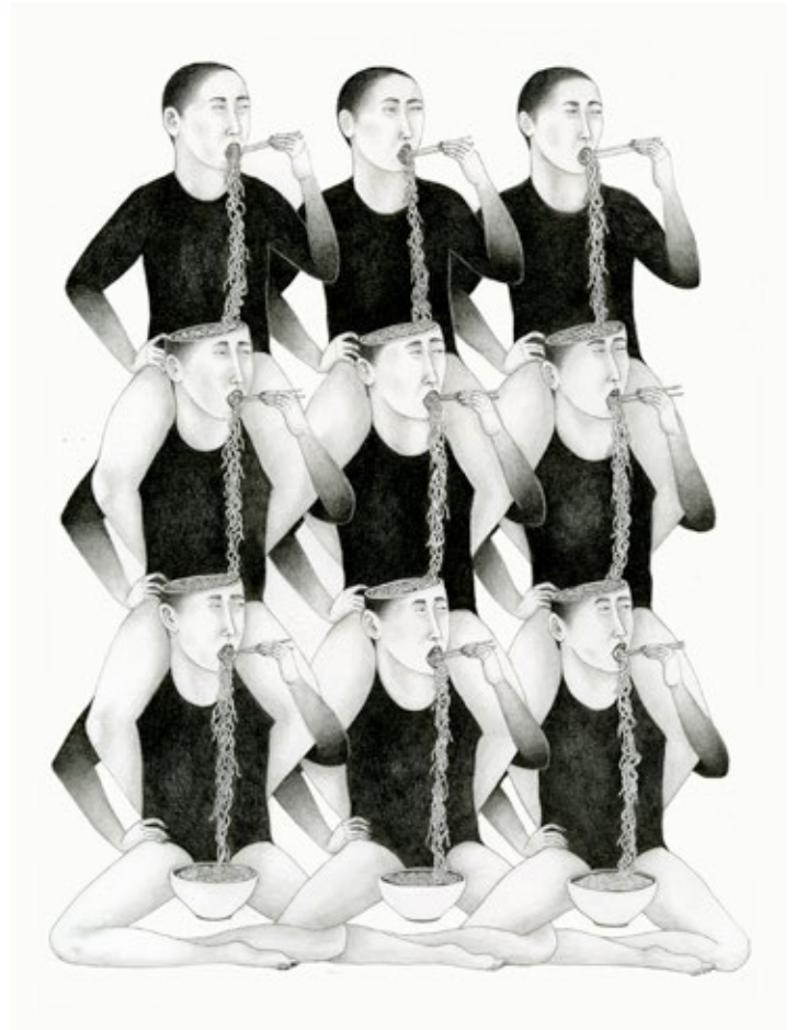
Conservative landscape, 2015.

Momenteel wel. De verfijning en fragiliteit van het potlood past erg goed bij wat ik wil vertellen. Door te werken in zwart-wit kan ik tot de essentie komen. Ik krijg vaak de reactie dat mijn werk erg Aziatisch aan doet, omdat het zo gedetailleerd is. Maar ik wil mezelf niet perse profileren als Aziatisch kunstenaar. De essentie van mijn beelden gaat voornamelijk over universele waarden, die in alle culturen kunnen voorkomen. Het is bovendien goed mogelijk dat ik binnenkort ter afwisseling weer met kleur ga schilderen.