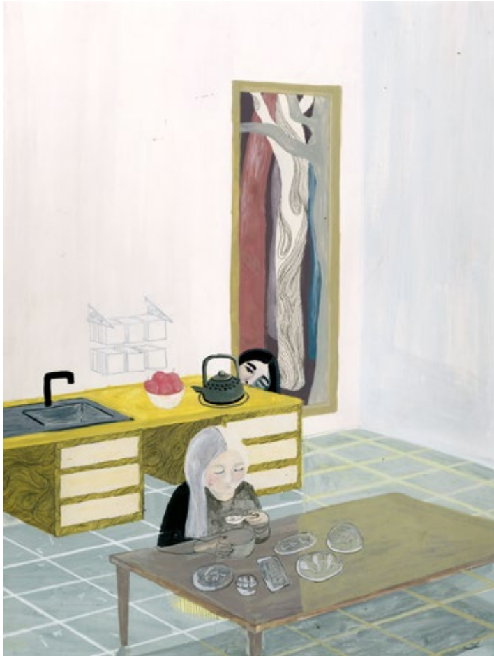
Traces of the self, 2014.