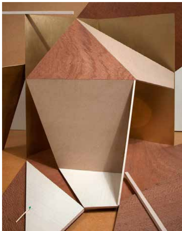
Wim Wauman, Indian Summer (The Scenery), 2014, foto, 70 x 55 cm

Het antwoord van Wim Wauman op een werk van El Lissitzky.