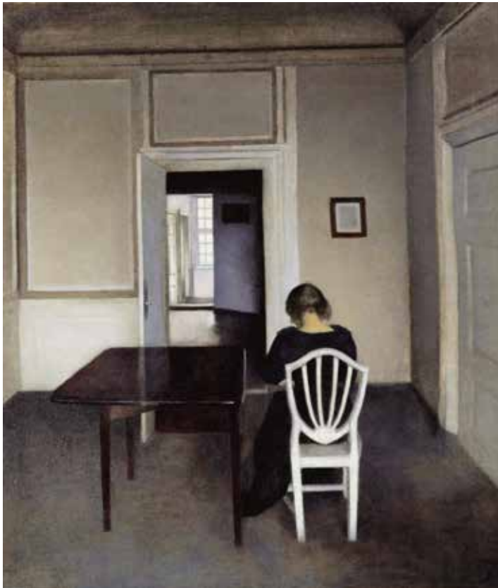
Vilhelm Hammershøi, Open deuren, interieur met vrouw op witte stoel, 1900, olieverf op canvas, 57 x 49 cm

Christiaan Kuitwaard maakte een ‘opgeruimde’ versie van het schilderij van Hammershøi. Hij verwijderde de tafel, liet de vrouw de kamer verlaten en wisselde de stoel in voor zijn eigen exemplaar.