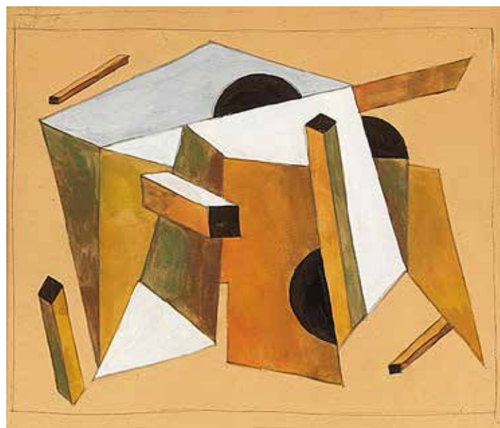
El Lissitzky, Proun, circa 1920, mixed media op papier, 20 x 25 cm

Wij schilderen alle drie, maar wel heel verschillend en dus met onze eigen voorkeuren. Daardoor trekt schilderkunst ons misschien instinctief sneller aan. Maar we houden een brede kijk en laten ook andere disciplines de revue passeren. We geven elkaar ook ruimte om eigen accenten te leggen. Dat houdt de blog breed en niet voorspelbaar.